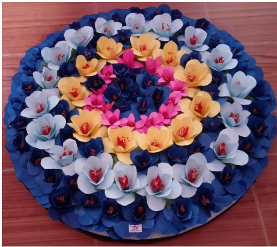
พวงหรีดดอกไม้ประดิษฐ์