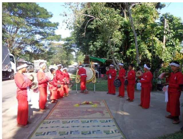
การแสดงตีกองสะบัดชัย