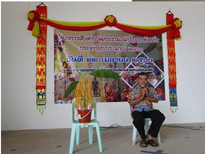
การร้องเพลงพื้นเมืองล้านนา