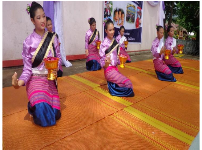
ฟ้อนผางประทีป