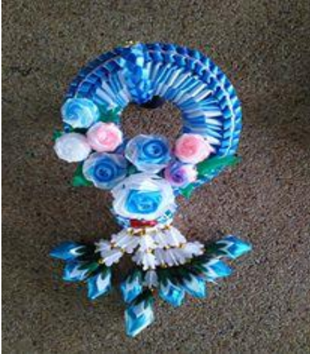
การประดิษฐ์พวงมาลัยดอกไม้

๘.๓ การทำบายศรี บายศรีงานแต่ง บายศรีสู่ขวัญ