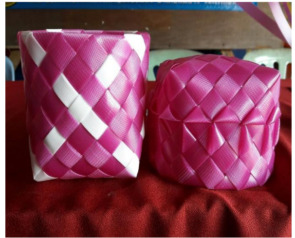
การทำกระติบข้าวเหนียว