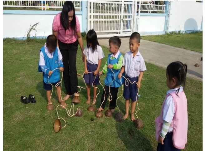
ก๊อปแก๊ป