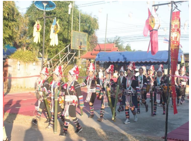
การเต้นกระทู้กระบอกไม้ไฟ