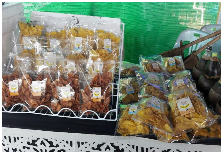
กลัวยเบรกแตกแม่จำเนียร