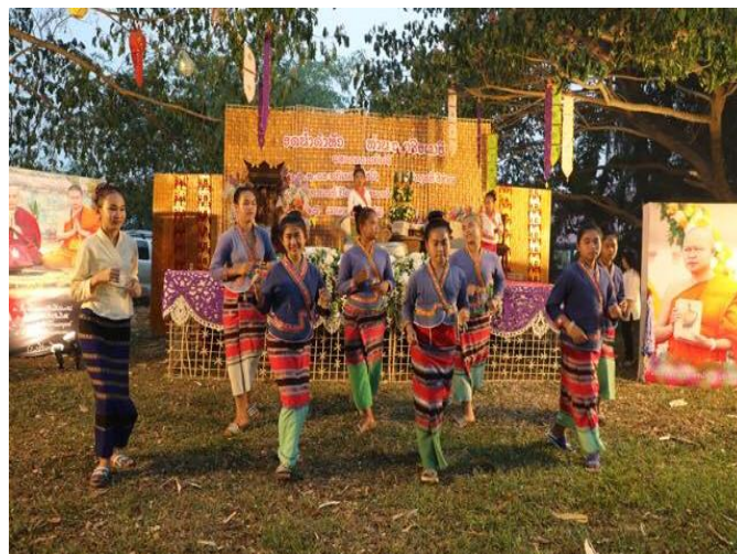
การแสดงเต้นเพลงลาพี ซ่าทอ (เพลงลาบพริก) และ เพลง เฝง หู้ บา ปี่ ซู (เพลง มาพูดภาษาปืซูกันเถอะ)