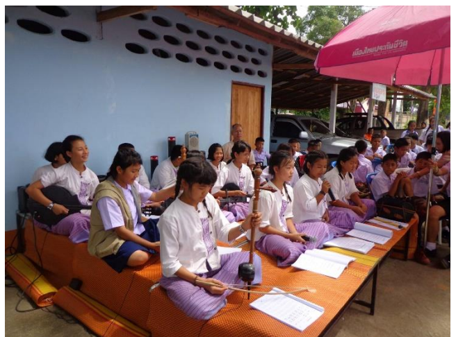
ดนตรีพื้นบ้าน เช่น สีสะล้อ ระนาดเอก ฆ้องวง