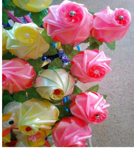
เหรีญโปรยทาน