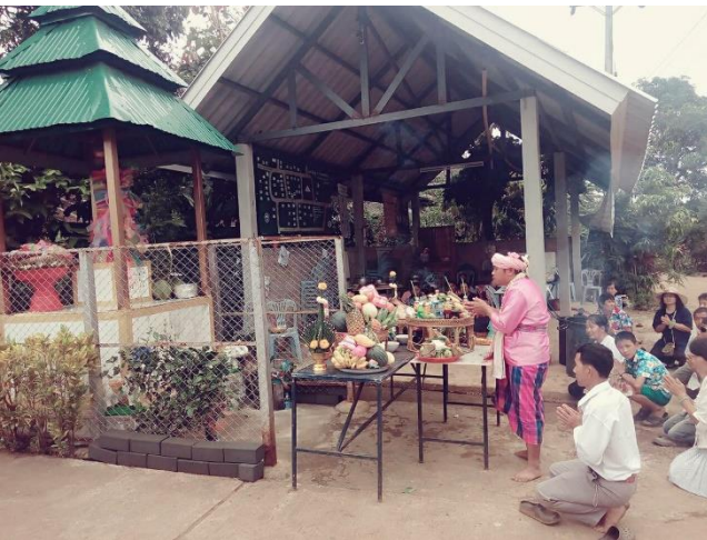
ประเพณีสักการะเสาหลักบ้านอินตะขิล