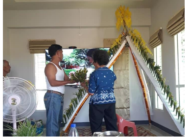
งานขึ้นบ้านใหม่