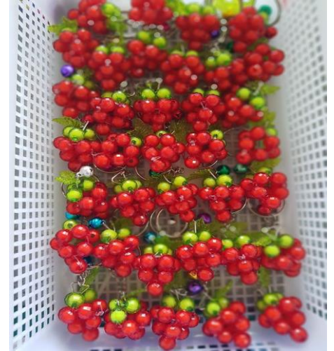
พวงกุญแจงุ่น, สตรอเบอร์รี่