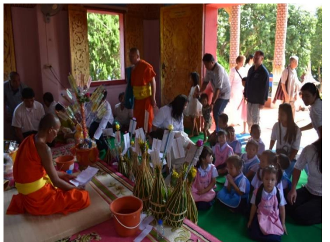
ตานก๋วยสลากภัต