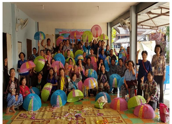
การทำฝาชีแพนซี