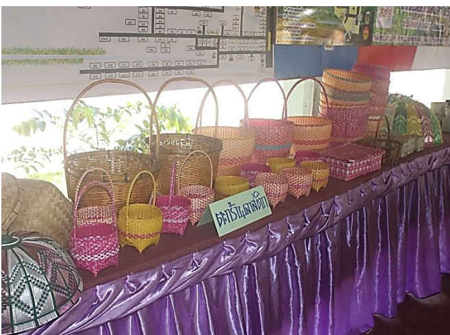
การประดิษฐ์ตะกร้า