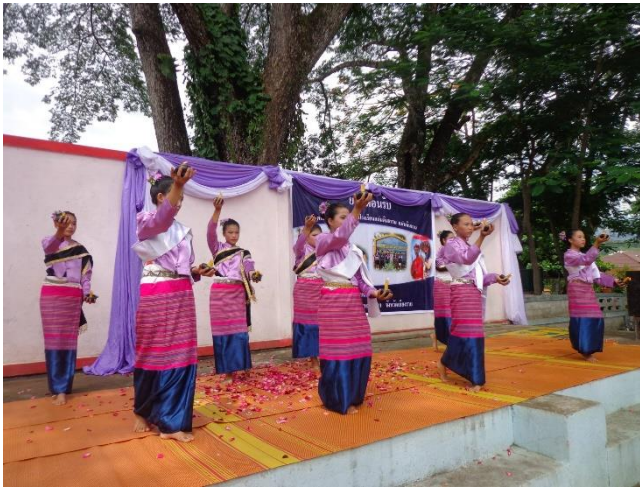
การฟ้อนรำอวยพร