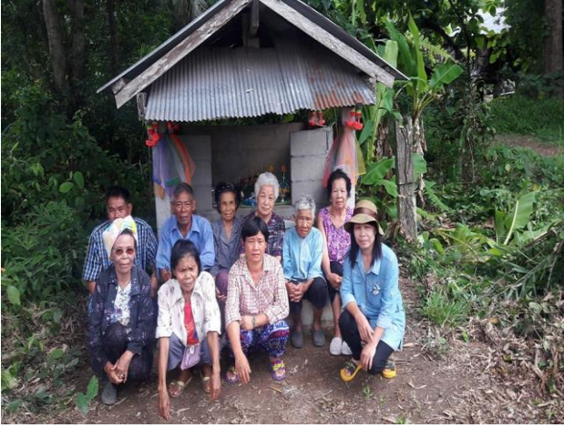
การเลี้ยงผีป่า