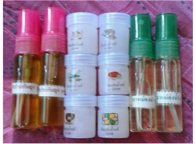
ยาหม่อง, พิมเสนน้ำ, สเปรย์ตะไคร้หอมกันยุง สูตรสมุนไพร