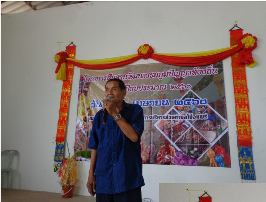
การร้องเพลงซอ