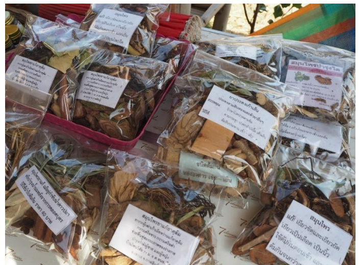
ยาต้มสมุนไพรรักษาโรค แก้วปวดเมื่อย ปวดข้อ คลายเส้น เก้าท์ รูมาตอยด์ ซามือ ชาเท้า