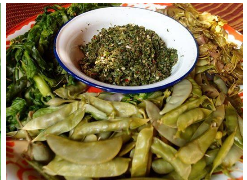
ลาบพริก บ้านดอยชมภู หมู่ ๗